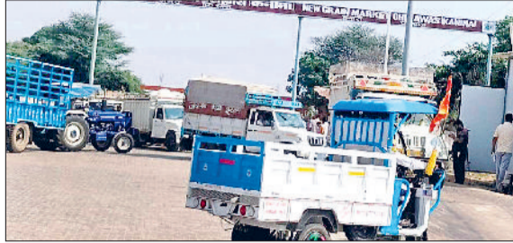
कनीना। अनाज मंडी चेलावास में आए किसानों के बाजरे भरे वाहन।

सरकारी शेड्यूल के मुताबिक 15 नवंबर तक हो सकती है बाजरे की खरीद: मार्केट कमेटी सचिव हरिभूमि न्यूज ॥ कनीना