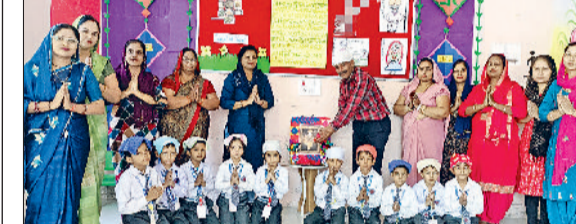
चरखी दादरी। गुरु नानक के चित्र पर पुष्प अर्पित करते।