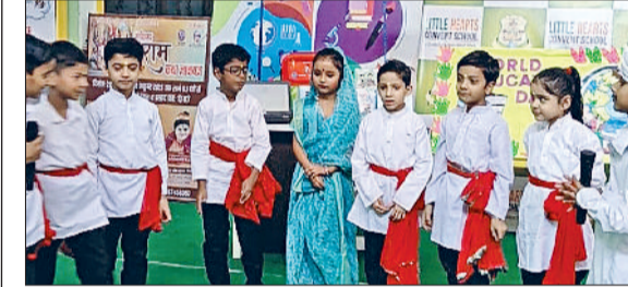
भिवानी। गुरु नानक देव जयंती पर प्रस्तुति देते विद्यार्थी।