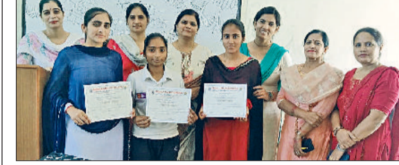
चरखी दादरी। प्रतियोगिता की विजेता छात्राओं को सम्मानित करते अतिथि।

बवानीखेड़ा। मिलकपुर स्थित आनंद स्कूल फॉर एक्सीलेस में गुरु नानक देव जयंती बड़े हर्षोल्लास और श्रद्धा के साथ मनाई। कार्यक्रम की शुरुआत प्राइमरी कक्षाओं के विद्यार्थियों द्वारा निकाली गई प्रगत फेरी से हुई, जिसमें बच्चों ने गुरु वाणी का पाठ किया और पूरे विद्यालय परिसर में पवित्र वातावरण बना दिया। बच्चों ने मधुर भजन के माध्यम से गुरु नानकदेव के उपदेशों और शिक्षाओं का संदेश दिया। कार्यक्रम में शिक्षकों ने भी सक्रिय रूप से भाग लिया और गुरुजी के जीवन से जुड़ी प्रेरणादायक बातें साझा कीं।