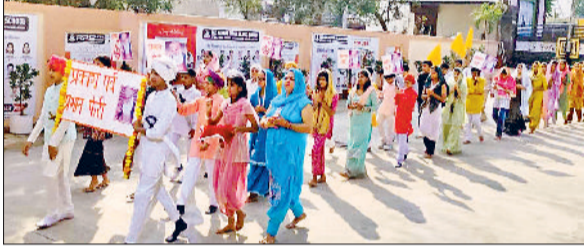
महेंद्रगढ़। रैली निकालते विद्यार्थी।