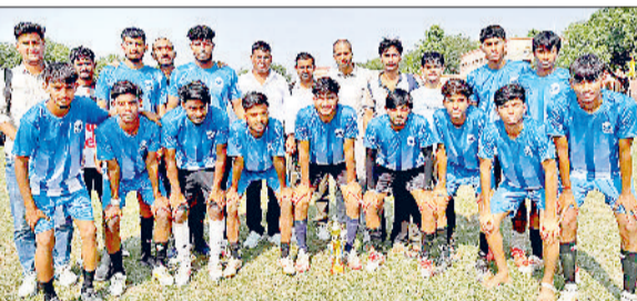
महेंद्रगढ़। ट्रॉफी के साथ विजेता टीम।