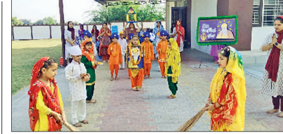
आनंद स्कूल फॉर एक्सीलेस में गुरु नानकदेव जयंती कार्यक्रम में प्रस्तुति देते