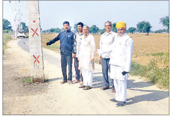
नारनौल। सड़क बीच में खड़े खंभे को दिखाते ग्रामीण।

गेटपास से 14766 क्विंटल, 28 को 633 गेटपास से 18387 क्विंटल, 29 को 708 गेटपास से 22648 क्विंटल, 30 को 953 गेटपास से 29474 क्विंटल, 31 को 740 गेटपास से 24206 क्विंटल तथा तीन नवंबर को 185 गेटपास से 5903 क्विंटल बाजरे की प्राइवेट खरीद की गई है।