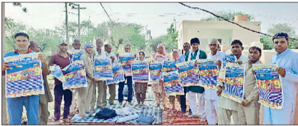
बाढ़ड़ा। रैली व अन्य मांगों को लेकर बैटक करते ग्रामीण सफाई कर्मचारी।