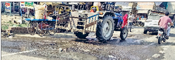
दिन यहां पानी के गुब्बारे चलते हैं, जिससे आने जाने वालों को ख़ासी समस्याओं का सामना करना पड़ता है। हालांकि विभाग को जानकारी

बवानी खेड़ा के शहीद गुलाब सिंह पार्क के सामने स्थित हांसी-भिवानी मुख्य मार्ग पर पानी कनेक्शन के लीकेज होने से करोड़ों की लागत से बनाई गई सड़क में गहरा गड्ढा बन गया। ये गड्ढा दिन-प्रतिदिन बढ़ता जा रहा है क्योंकि पीने के पानी की पाइपलाइन होने व विभाग द्वारा पीने के पानी की सफाई चलाने पर आए