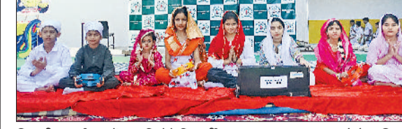
भिवानी। कार्यक्रम में प्रस्तुति देते विद्यार्थी।