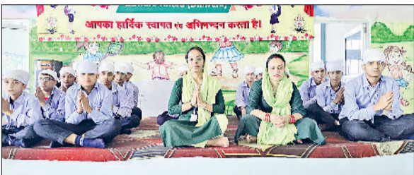
बवानीखेड़ा। श्रीलाल बहादुर शास्त्री वरिष्ठ माध्यमिक विद्यालय में गुरु नानक देव जयंती कार्यक्रम में भाग लेती शिक्षिकाएं व विद्यार्थी।